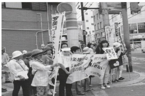
奄美大島・名護市の街宣