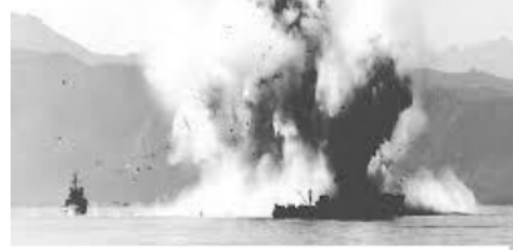
元山沖を掃海中に触雷、爆発した韓国軍の掃海艇