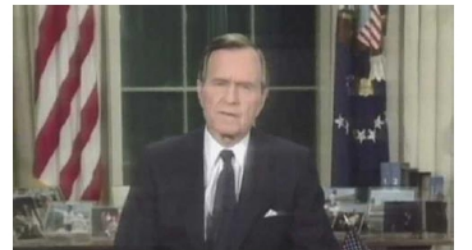
湾岸戦争の開始を宣言するブッシュ大統領