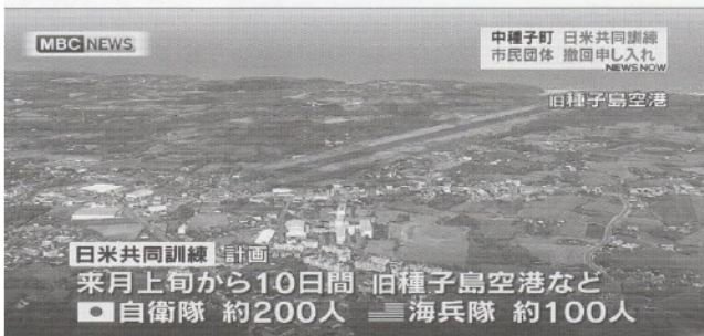
日米共同訓練を報じるMBC南日本放送。写真は旧種子島空港で、新空港開港後は使用されていない（滑走路が短い）。自衛隊は、このような南西諸島の旧空港などを、F-35Bの基地として虎視眈々と狙っている