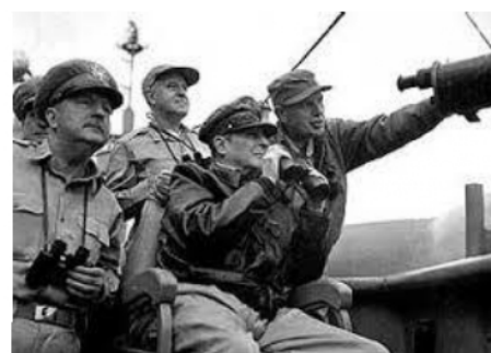
仁川に上陸したマッカーサー