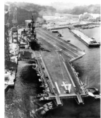
1981年6月1日。疑惑の中、空母ミッドウェーが入港

トマホークミサイルは核搭載可能な長距離巡航ミサイル。攻撃型潜水艦や水上艦に実戦配備すると発表され、世界的に反対運動があり、日本の市民団体にも反対の声が高まり