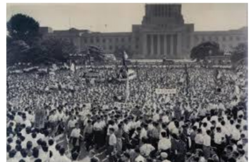
安保反対闘争(国会前)