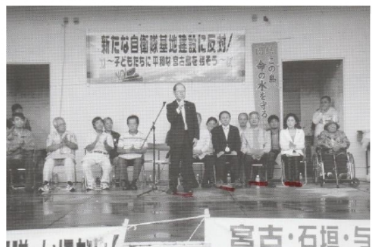
16年11月の自衛隊配備に反対する宮古島集会。沖縄選出の全国議員が参加した