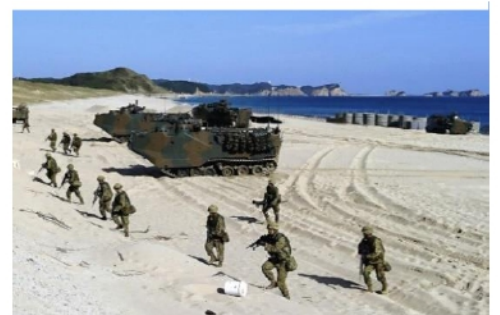
種子島での共同演習