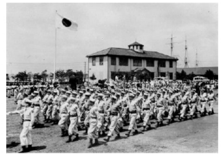
発足式で観閲行進する自衛官