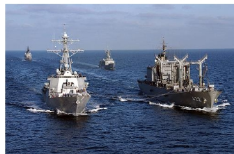
給油中の補給艦「とわだ」（右）と、後方は警戒に当たる護衛艦