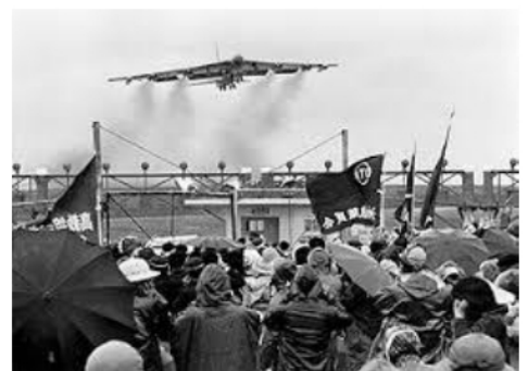
沖縄でのベトナム反戦闘争

①日本の安全は極東の平和と安全なくして不十分 ②極東諸国の安全は日本の重大な関心事。韓