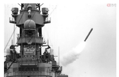
イラク戦争で発射されるトマホーク