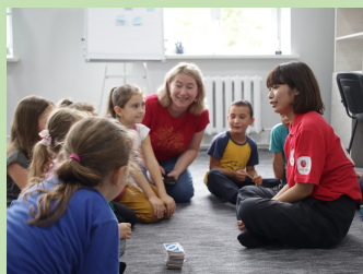
モルドバでのウクライナ難民支援